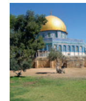
Israel-Palästina Aktuelle Situation

Im Restaurant JoJo, St. Josef-Stiftung, Bremgarten