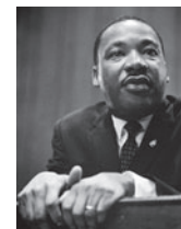
Martin Luther King 1929–1968