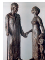
Dorothea von Flüe ca. 1433–1481