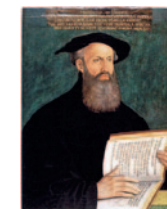
Heinrich Bullinger 1504–1575