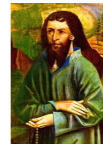
Niklaus von Flüe 1417 – 1487