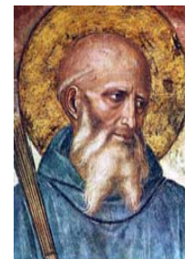
Benedikt von Nursia 480 – 547