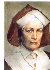
Hildegard von Bingen 1098 – 1179