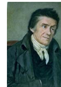
Johann Heinrich Pestalozzi 1746 – 1827

Im Restaurant JoJo, St. Josef-Stiftung, Bremgarten